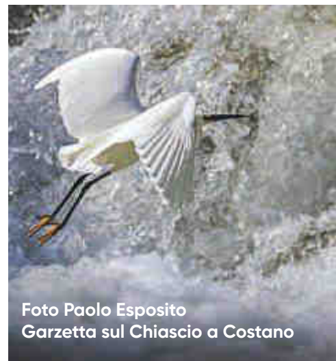
Garzetta sul Chiascio a Costano