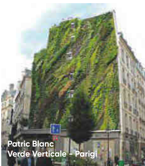
Patric Blanc Verde Verticale - Parigi