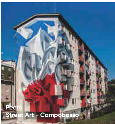
Peeta Street Art - Campobasso