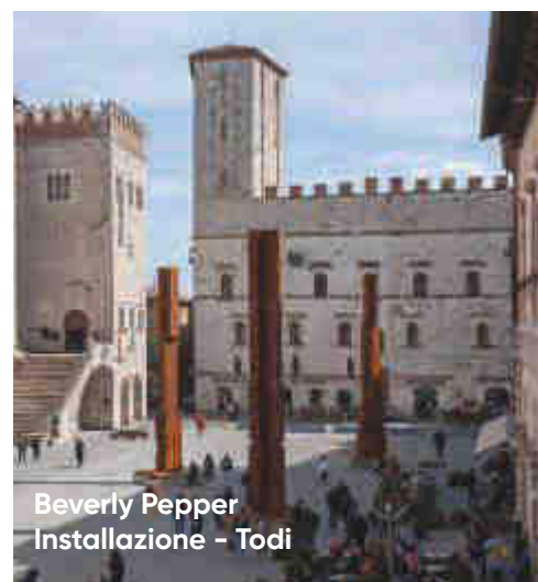
Beverly Pepper Installazione - Todì