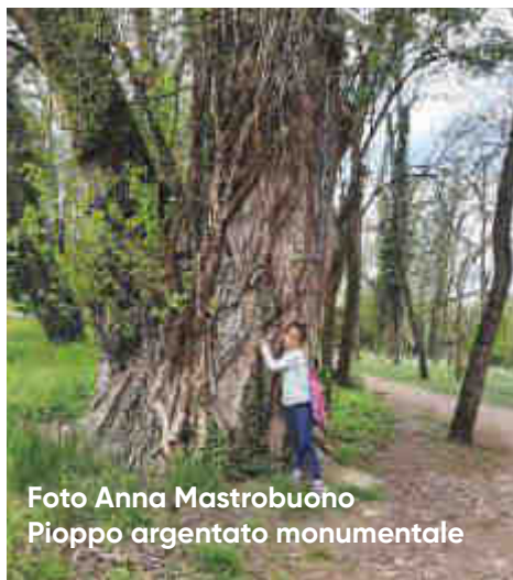
Pioppo argentato monumentale