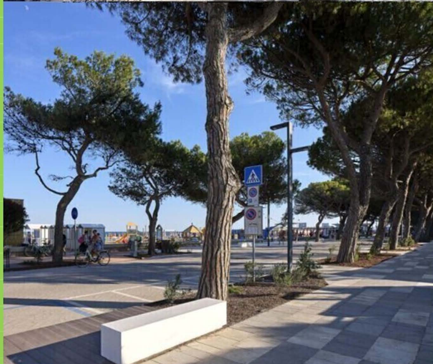
Lignano Sabbiadoro, lungomare Trieste dopo intervento di riqualificazione

Principio "non arrecare danno all'ambiente" - Il parziale finanziamento del PNRR ne obbliga il rispetto che risulta palesemente disatteso considerando l'eliminazione dell'enorme massa vegetale e la conseguente eliminazione di: stoccaggio di CO2, produzione di ossigeno, captazione di particolato inquinante, effetto di mitigazione della temperatura da ombreggiamento.