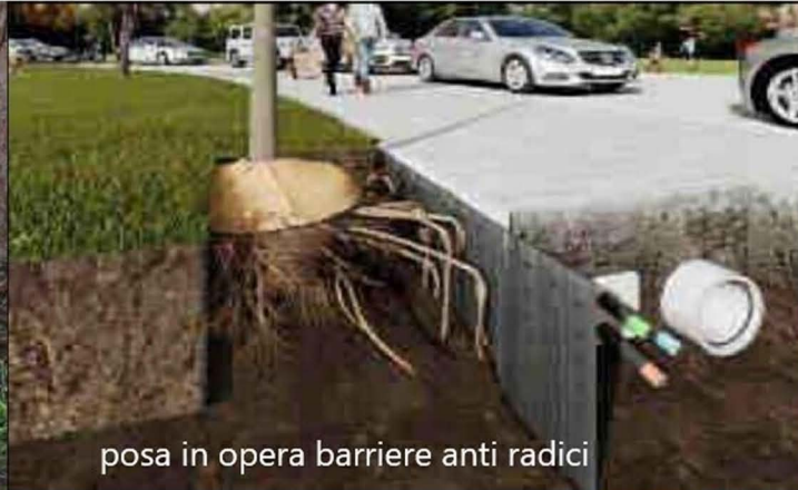
posa in opera barriere anti radici