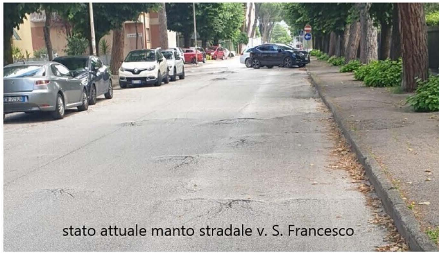
stato attuale manto stradale v. S. Francesco