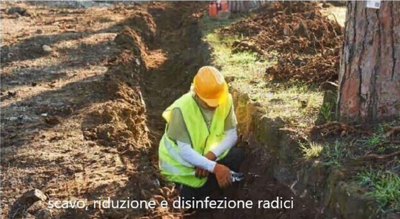
scavo, riduzione e disinfezione radici