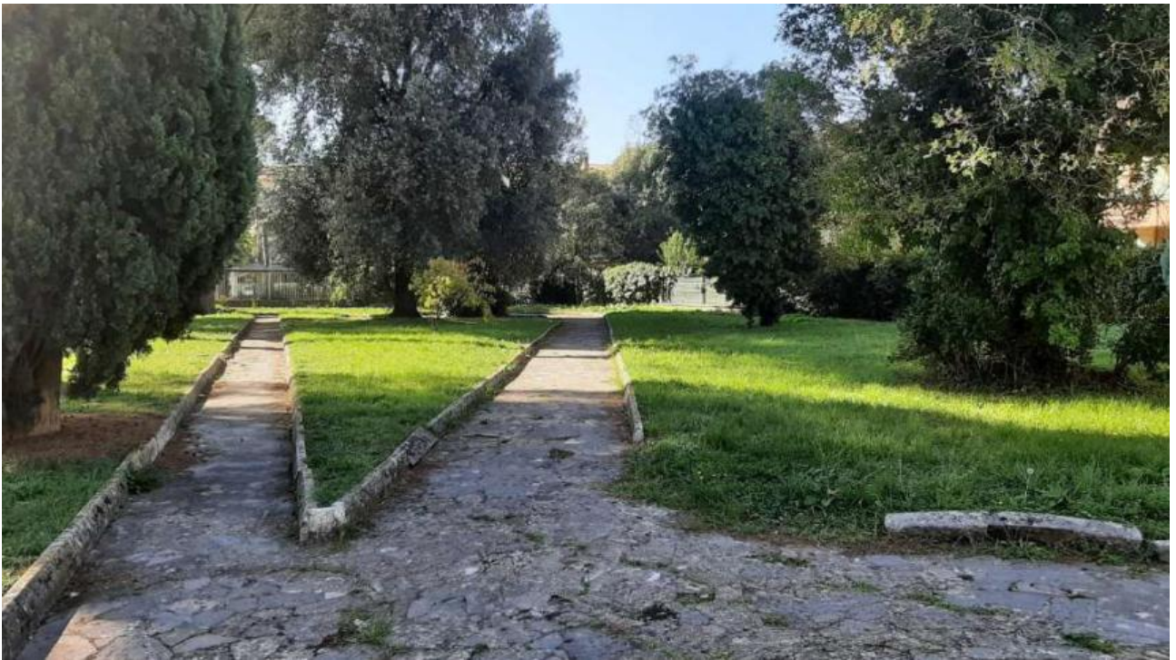
foto 03_ I giardini di Viale Giontella